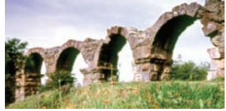
* Pisidia Antiokheia Antik Kenti