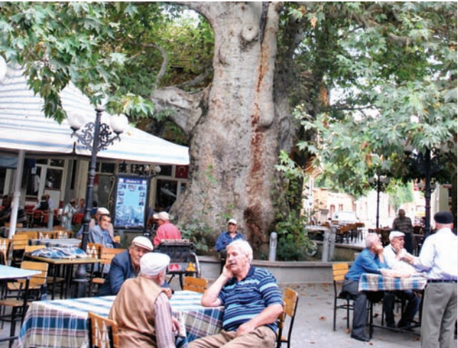
* Ulu Çınar

1200'lü yıllarda dikildiği tahmin edilen anıtsal çınarın boyu 6 m, gövde çevresi 10,25 m, çapı 3,26 m, ağacın dal genişliği ise 7,50 m ile 15,80 m arasında değişmektedir. Kentte "Çınaraltı" olarak bilinen bu yer, insanların buluştuğu ve oturup sohbet ettiği önemli bir merkezdir.