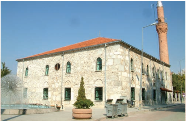
* Devlethan Camii

II. Kılıçaslan'ın kardeşi Devlet Han adına yapılan caminin, mimarı belli değildir. Cami, Beylikler Dönemi cephe özelliklerine sahip olup, üç sütun dizisiyle dört sahna ayrılmıştır. Duvarlarında Pisidia Antiokheia'dan getirilme devşirme malzeme kullanılmıştır.