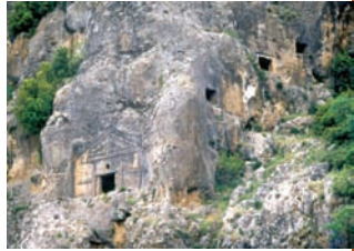
* Kaya Kilisesi ve Mezarları

Hoyran Gölü'nün doğu kısmında yer alan kaya mezarları Yalvaç'a 30 km uzaklıktadır. Yöre halkı tarafından "Kral Mezarı" olarak adlandırılan kilise, Erken Bizans Dönemi'ne aittir.