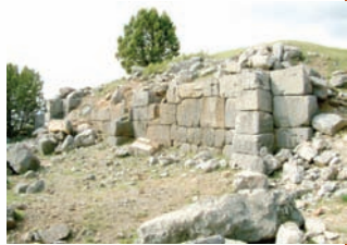
* Men Kutsal Alanı ve Tapınağı

Ay Tanrısı Men adına inşa edilen Men Kutsal Alanı, Yalvaç'a 5 km uzaklıkta Gemen Korusu'nda bulunmaktadır. Men Tapınağı çevresinde bulunan diğer yapılar, küçük tapınak, stadion, tören salonu, kült yemeklerinin yendiği bir ev ve 20 kadar niteliği tam anlaşılamayan yapılarıdır.