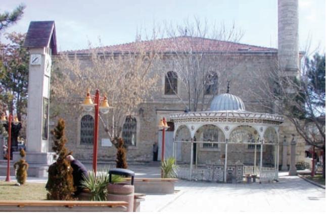
* Yeni Cami

Cami, 19. yüzyıl geç Osmanlı Dönemine aittir. Yaklaşık kare planlı olup, harim kısmındaki kubbe dört sütuna oturur. "Çarşı" veya "Hamidiye Camii" olarak da anılır.