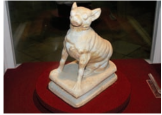
* Yalvaç Müzesi